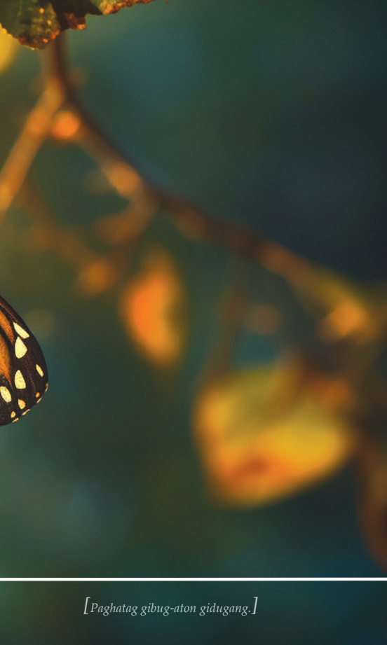
[Paghatag gibug-aton gidugang.]

ug ang makapausab nga gugma ni Jesu Cristo. Kini maoy hinungdan nga ang mabangis nga manglulutos siya sa iyang kaugalingon gilutos usab alang kang Jesus, ug gimantala niya ang Iyang mensahe nga way pagkahadlok, nga nag-atubang sa tanang klase sa kalisod, bisan ang kamatayon sa kaugalingon. Aduna usab lahi nga matang sa pagkakabig sama sa kaso ni Nicodemo. Mikabat ug tulo katuig human niadto nga pakighisgot uban ni Jesus (tan-awa ang Juan kapitulo 3) alang kang Nicodemo sa pag-abot sa punto nga mahimong mapadayag ang iyang pagtuo kang Jesus ug magatugyan sa kinatibuk-an sa iyang kaugalingon ngadto sa nalansang nga Mangluluwas.