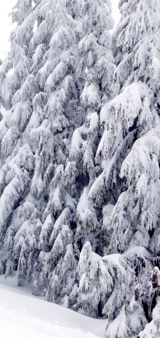
Својот план за спасение.